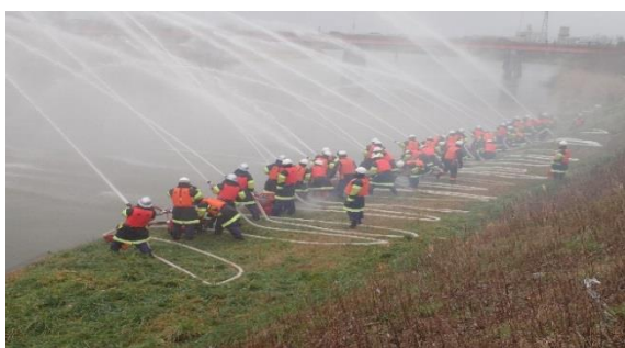
燕市消防団 中ノ口川における放水披露