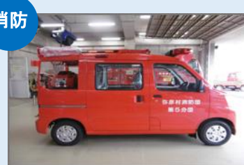
弥彦村消防団小型動力 ポンプ付積載車