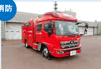
水槽付消防ポンプ自動車 (吉田消防署)