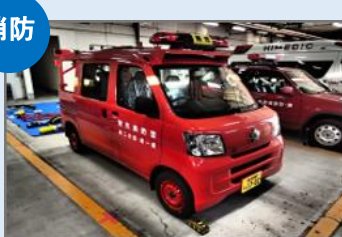
燕市消防団小型動力 ポンプ積載車