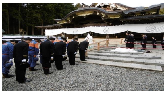
弥彦村消防団 彌彦神社における無火災祈願

平成 31 年 1 月 6 日(日)、燕市消防出初式及び弥彦村消防出初式を行いました。