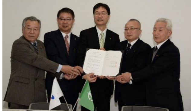
基本協定締結式(平成30年2月7日)