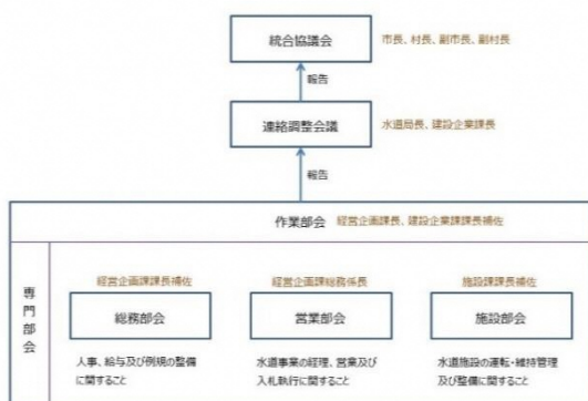
統合協議に関する検討体制