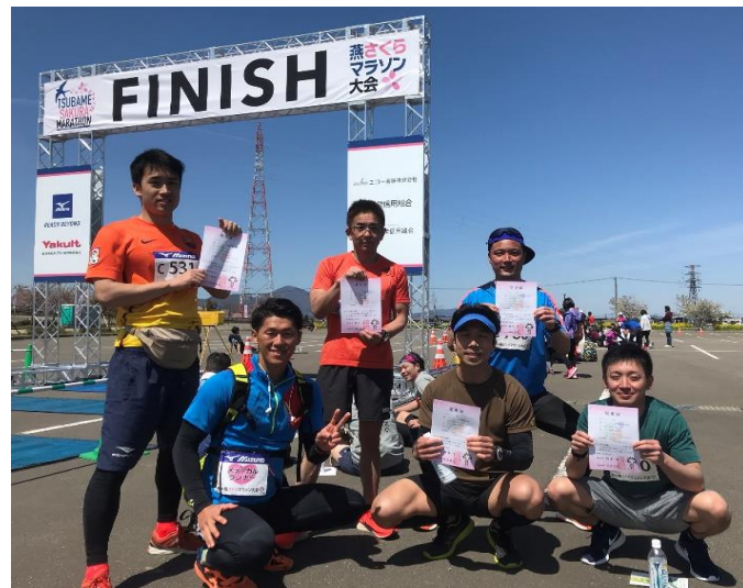
メディカルランナーとしてハーフマラソン完走

なお、大会当日は、医師、看護師を含め11人がメディカルランナーを務め、事故等もなく無事大会が終了しています。