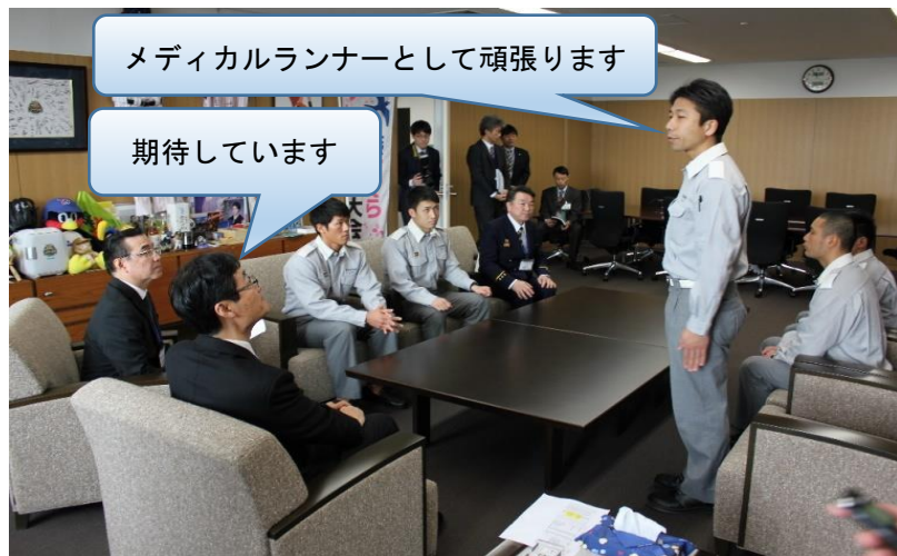
4月11日、管理者 燕市長へ参加報告