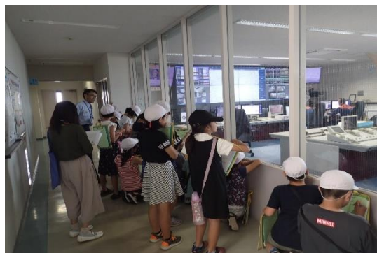
<通信指令業務の学習>