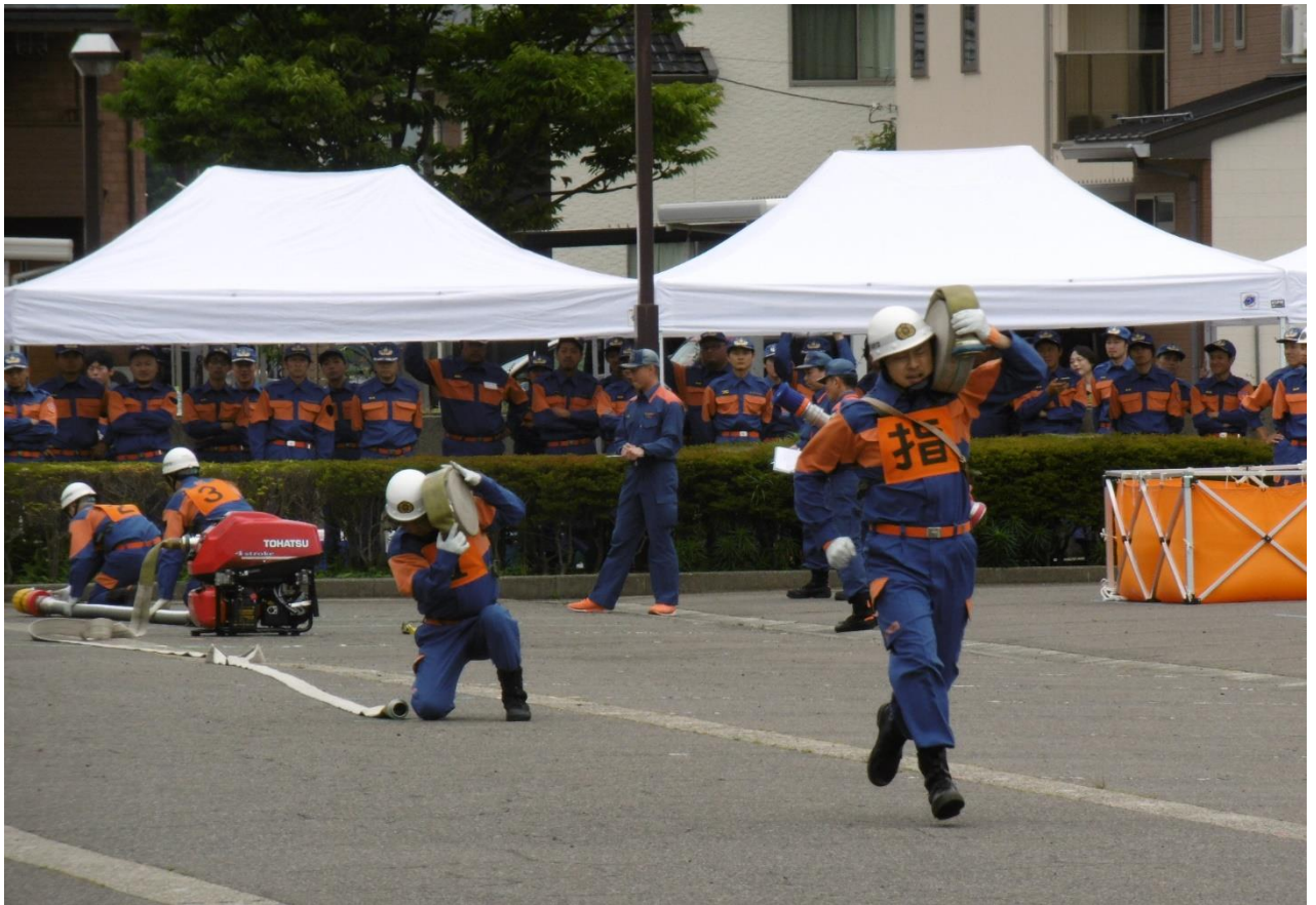
<小型ポンプ操法競技会>

令和元年6月23日（日）、弥彦村役場駐車場にて「弥彦村消防演習」を行い、地域住民の防火に対する理解と防火意識の高揚を図りました。