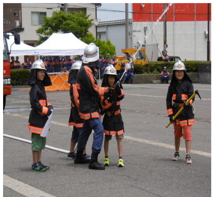
<ちびっ子消防隊放水披露>

消防団員による「小型ポンプ操法競技会」では、ポンプの操作やホースの取扱いなど、消火活動の基本動作についての安全性、確実性、迅速性を競うことで消防戦術の向上を図り、また弥彦小学校4年生による「ちびっ子消防隊」の放水も披露され、児童の放水に会場から大きな拍手が送られていました。