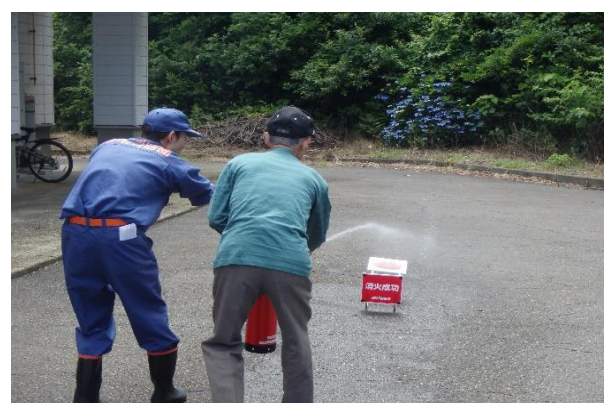
消火器取扱い講習