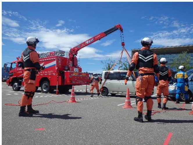
新潟県警察本部等と連携した事故車両救出訓練