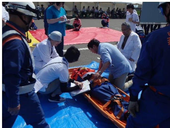
燕市医師会等によるトリアージ訓練