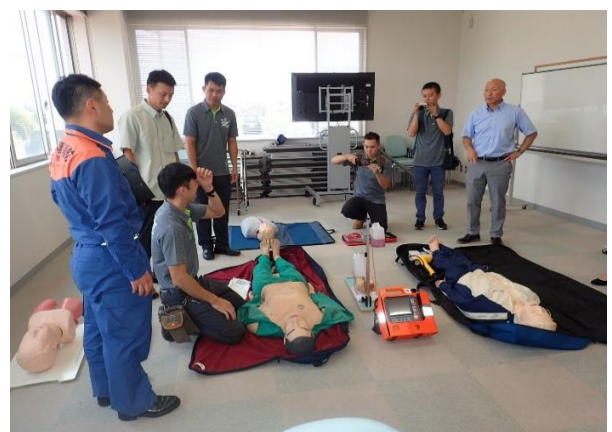
台湾の救急救命士によるデモ訓練