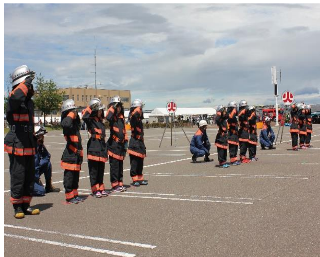
ちびっこ消防隊による放水訓練