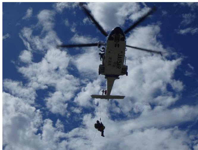
新潟県消防防災航空隊による負傷者救出訓練

また、燕東小学校、吉田南小学校、分水小学校4年生による「ちびっこ消防隊」の放水披露や燕市吉田若生町自治会によるバケツリレーが行われ、会場から大きな拍手が送られていました。