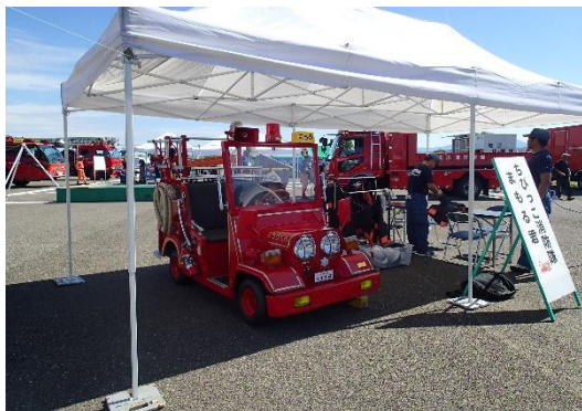
ミニ消防車まもる君とともに走り出す！

当日は約2,500人が来場し、大人気のはしご車の搭乗や起震車による地震体験や濃煙体験、ちびっ子に嬉しいミニ消防車まもるくん、ちびっこ救助隊などに家族連れなどが列をつくり大盛り上がりを見せました。