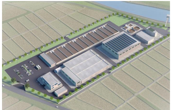
※統合浄水場イメージ図