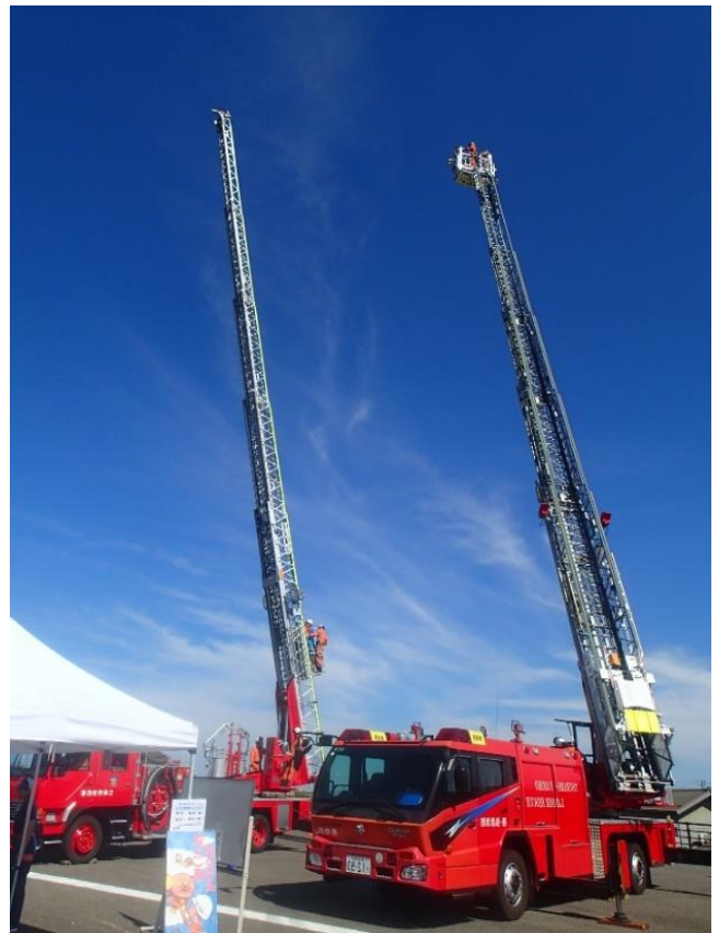
35mはしご車 三条消防と一緒に