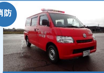
消防指令車 (弥彦消防署)