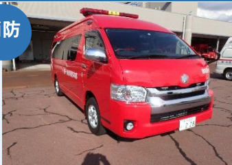
消防指令車 (吉田消防署)