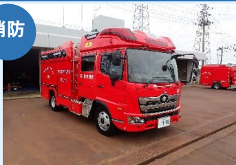
水槽付消防ポンプ自動車 (燕消防署)