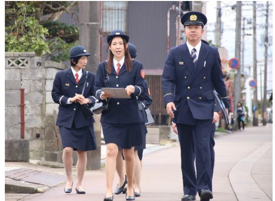
合同での訪問巡回