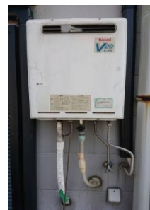
給湯器(周辺)も注意が必要です