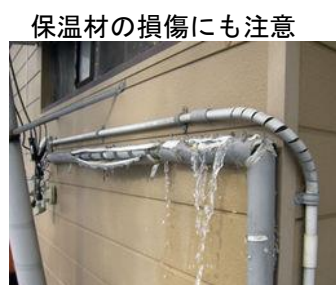
保温材の損傷にも注意