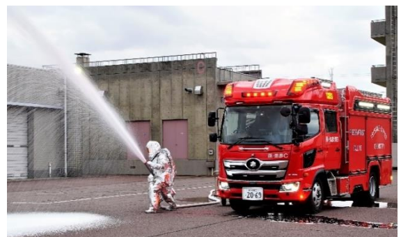
化学防護服を着装しての放水訓練