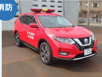
消防指令車 (分水消防署)