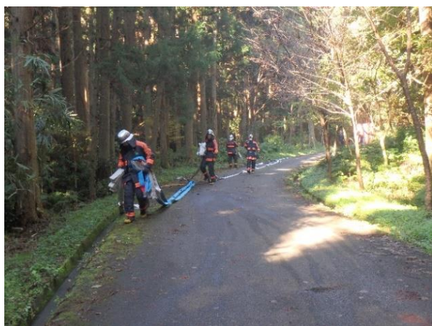
傾斜地ホース展張の様子