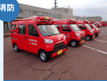
小型動力ポンプ積載車 (燕市消防団)