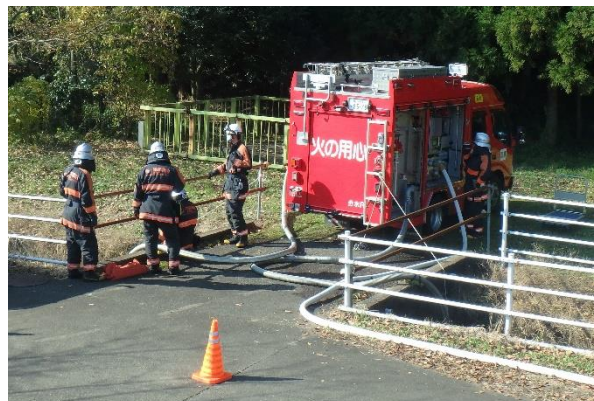
自然水利を利用したポンプ車による揚水