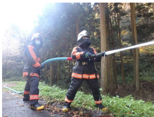
ガンタイプノズルによる放水隊形