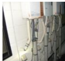
給湯器(周辺)も注意が必要です