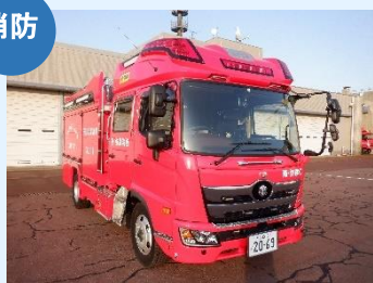
化学消防ポンプ自動車 (吉田消防署)