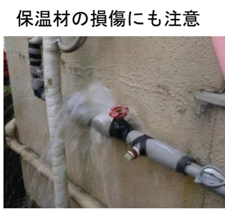
保温材の損傷にも注意